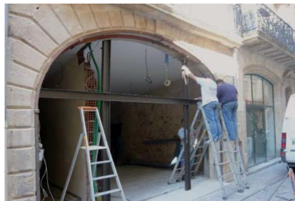
Réhabilitation de la façade