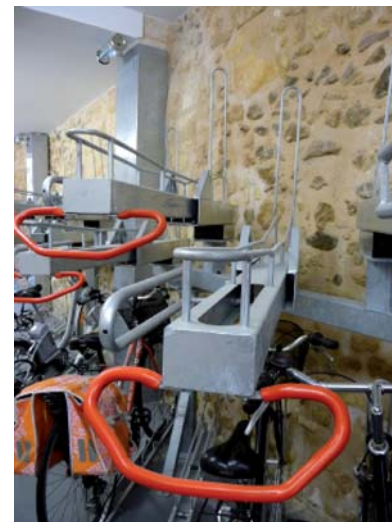
Un système de racks innovant