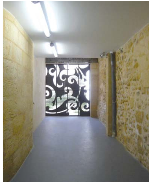
Local après les travaux

La devanture a été sécurisée et traitée de façon optimale tout en maintenant l'architecture inhérente au quartier, afin de permettre un usage confortable du local et la remise en valeur de façon contemporaine de l'arcade d'origine.